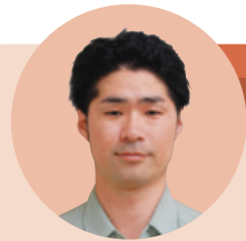
郡山工場 パーオキサイド製造部

保土谷化学グループは、事業活動を営んでいく上で、コミュニティの持続的発展への貢献は企業市民として重要な活動であると考えております。化学を通じた子供たちの育成、工場が立地する地域での環境保全活動や、人々の豊かな暮らしに役立つ有形物・無形物の提供等、さまざまな地域貢献活動に取り組んでおります。